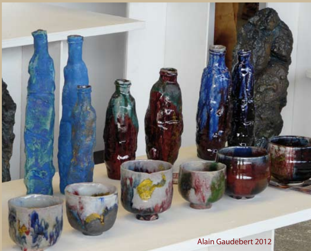
Alain Gaudebert 2012

COMMUNAUTÉ DE COMMUNES.....Delphine - 05 53 56 95 57